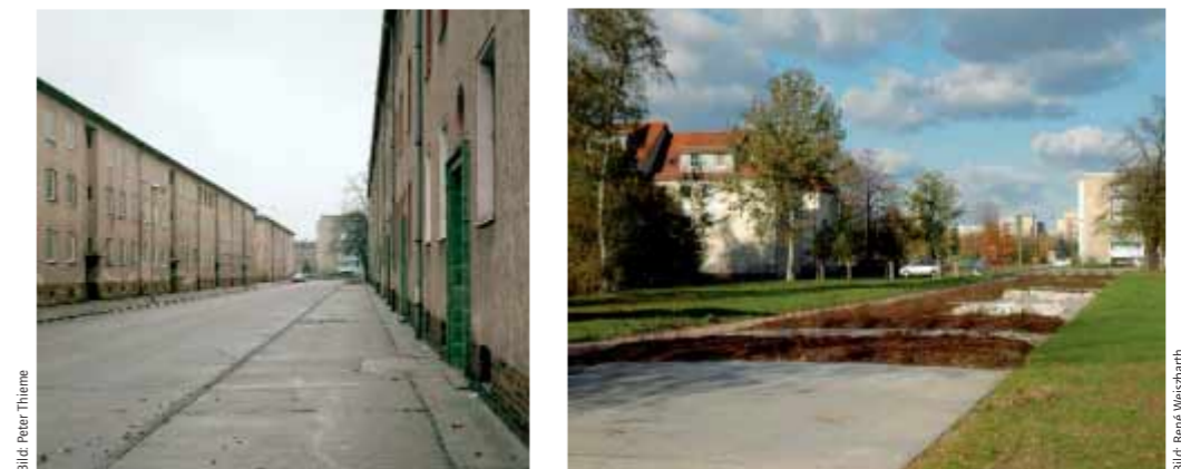
Leerstehende Gebäude werden über einen geordneten Abriss in Landschaft rückgebaut; Dessau, Gartenstrasse 2004 und 2006