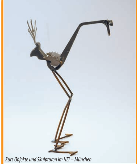
Kurs Objekte und Skulpturen im HEi – München

»Kreativität ist keine Eigenschaft, die nur besonders begabte Menschen oder Künstler erreichen können, sondern eine Haltung, die jeder Mensch erreichen kann. Erziehung zur Kreativität ist gleichbedeutend mit der Erziehung zum Leben.«