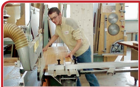
Eine Tischkreissäge und andere große Schreinermaschinen hat nicht jeder zu Hause.

Offene Werkstätten gibt es in verschiedenen Größenordnungen. Manche Häuser beherbergen nur eine Werkstatt, andere bieten ein breites Angebot an – von Tischlern und Schweißen über Nähen und Goldschmieden bis hin zu Kochen und Papierschöpfen. Bei einigen beschränkt sich das Angebot auf klassische Gewerke, in anderen finden sich auch Foto- und Musikstudios. Oft gibt es zum Fachsimpeln und für die Pause ein Werkstattcafé. vielerorts haben sich Offene Werkstätten als Stadtteil- oder regionales Zentrum etabliert, sie weisen zum Teil hohe BesucherInnenzahlen auf und erwirtschaften einen erheblichen Teil ihrer Betriebskosten selbst. Trotzdem benötigen Offene Werkstätten öffentliche Unterstützung: Durch Vermittlung oder Überlassung eines Gebäudes oder Geländes, Gewährung eines Unkosten- bzw. Betriebskostenzuschusses, die Anerkennung als Beschäftigungsträger etc. Die Stadt München fördert das »Haus der Eigenarbeit« mit einem jährlichen Zuschuss wie die Stadt Kempten »ihr« Kempodium.