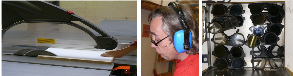
Schutzelemente: Schutz- und Absaughaube Kreissäge, Schiebestock; Ohrenschützer; Schweißbrillen

Die zuständige Bezirksverwaltung kontaktieren und offene Fragen klären, bzw. Vertreter zur