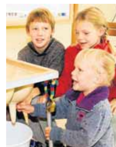
Die Kinder hatten am Melken im Kempodium besonderen Spaß.

aus Durach Möbel fürs Klassenzimmer erstellt. Von 8 bis 15 Uhr seien die Schüler eine Woche lang mit Feuerseifer bei der Sache gewesen – die Mädels hätten in den Raumteiler sogar noch Mosaikarbeiten eingebracht, strahlte Feiersinger. Und das neue Kempodium-Programm mit vielen „bodenständigen Kursen“ könne sie nur empfehlen.